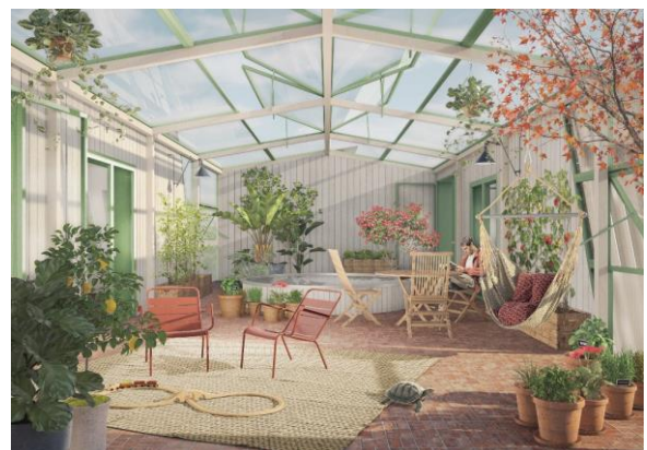
Gemeinschaftlicher Wintergarten im zweiten Obergeschoss