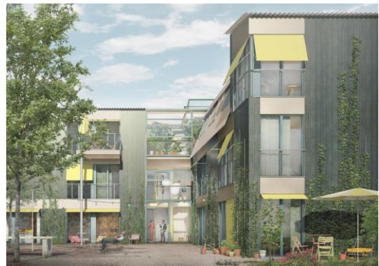
Erscheinung zur Attikerstrasse