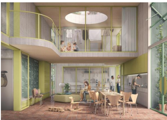
Blick in die Lobby mit gemeinschaftlicher Nutzung